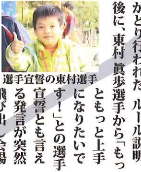
選手 宣誓 宣言とも言葉 飛び出し会場

射抜いて雄叫びを上げた。他にも林業業者の恰好をした、林業マンやSWATのコスプレで登場した選手も的を