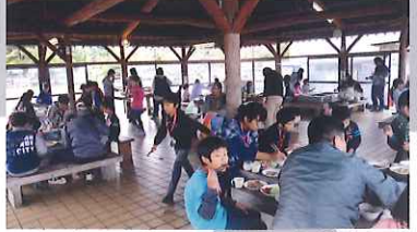
生活クラブさんのBBQも大盛況!